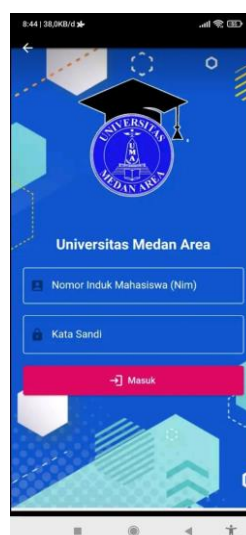
Gambar 2. Tampilan Menu Login SAIS UMA

NB. Akses Loginnya sama dengan Login AOC ( Jika lupa password bisa hubungi IT SUPPORT MH (yovie))