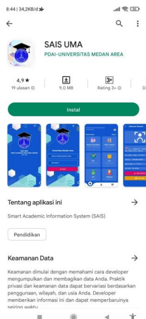
Gambar 1. Tampilan Aplikasi SAIS UMA di android

Setelah itu di install sesuai perangkat yang dimiliki, Berikut contoh penggunaan dari android.